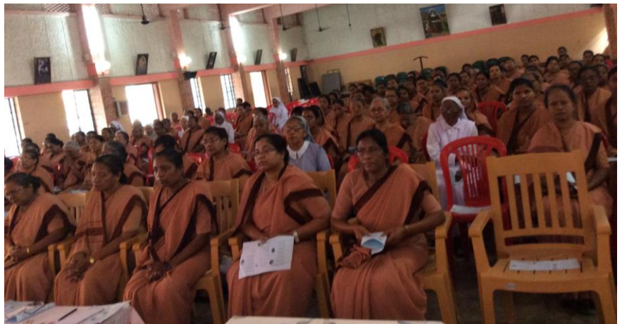
Les sœurs pendant la session

Dans son discours inaugural, en citant les paroles du Pape François, elle a invité les Sœurs à se réjouir et à éveiller le monde. Elle les a interpellées à se réveiller et à répondre aux besoins du temps avec promptitude et audace. Par une présentation power point, elle a partagé les résultats du Conseil