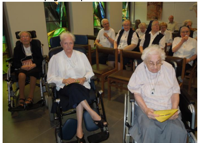
Les sœurs de Floordam en priere

Il y a toujours quelque chose qui se passé à Floordam. Nous avons la Messe tous les jours dans notre chapelle. Les sœurs du Home