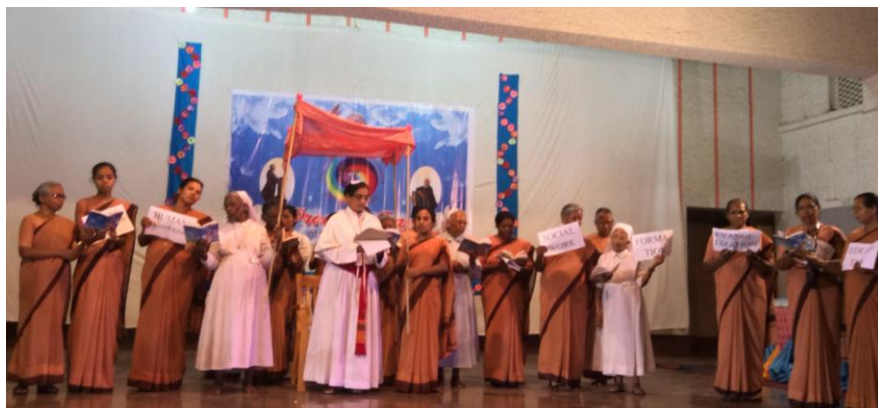
Programme de détente culturel du soir

Le programme culturel de la soirée du 6 juin était vraiment unique. Tous les Sœurs, selon leur diocèse, ont présenté des numéros très créatifs et haut en couleurs. C'était fantastique. Toutes ont ri aux larmes !