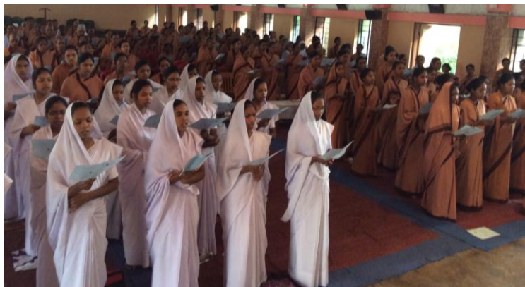
Célébration eucharistique des sœurs et novices

Lors de la dernière session, le 7 juin, il y eut du temps pour des discussions ouvertes et pour l'évaluation. La participation spontanée et active des Sœurs était très agréable et